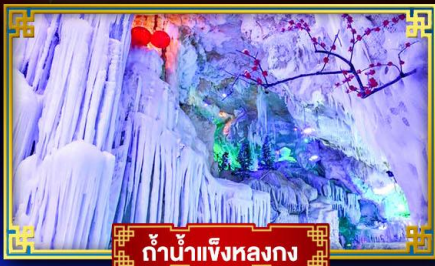
กำนันเจียงหลงกง

"เที่ยว 2 มณฑล กวางซี-กัชโจว" สุดอลังการ น้ำตก 2 พรหมแดน แหล่งท่องเที่ยวระดับ 5A