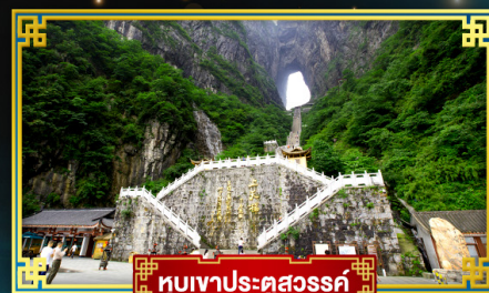
อุทยานประตูสวรรค์