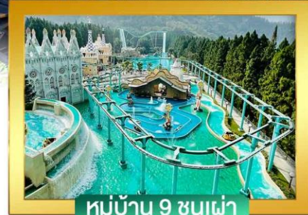
หมู่บ้าน 9 ชนเผ่า