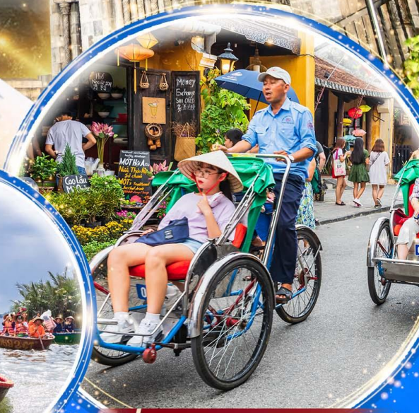
นั่งรถสามล้อซิโคล