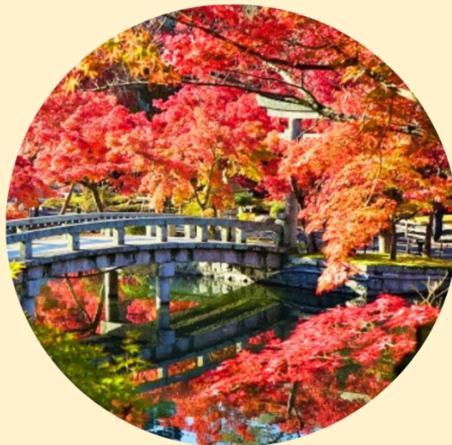
จุดร้านน้ำชา และนกพิราบ ที่ให้ภาพบรรยากาศที่งดงามของลานนั่งสีแดง ที่ปกคลุมไปด้วยใบไม้เปลี่ยนสี

บ่อน้ำที่อยู่ใจกลางวัด มีสะพานข้ามมายังศาลเจ้าถือเป็นจุดถ่ายภาพยอดนิยม