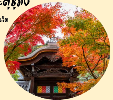
จุดประตูซุง เป็นประตูด้านใน บริเวณด้านในวัด