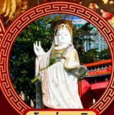
เจ้าแม่กวนอิม รีพัลส์เบย์