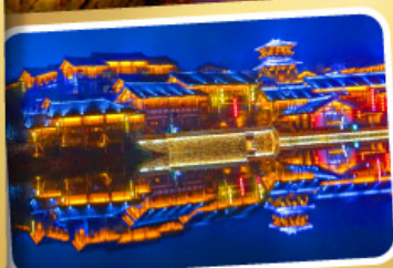
Oriental Salt Lake City