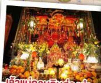
เจ้าแม่กวนอิมฮ่องฮำ