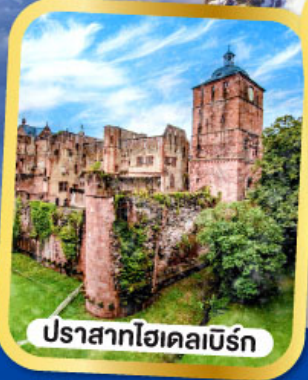
ปราสาทไฮเคลเบิร์ก