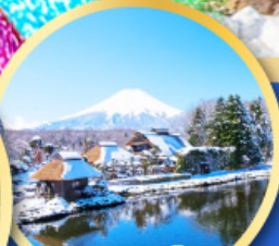
หมู่บ้านน้ำใส ไอชิโนะอัทสึ