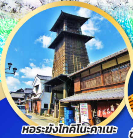
หอรบั้งโทคิโนะคาเนะ