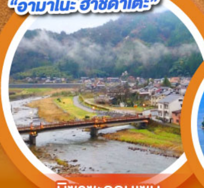
มิซาเซออนเซน