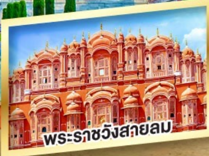
พระราชวังส่วยลม