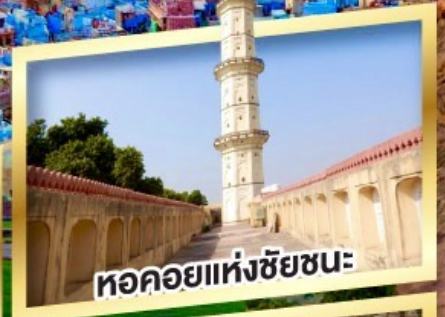
หอคอยแห่งชัยชนะ