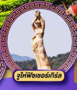
จูไห่พิงเซอร์เกิร์ล