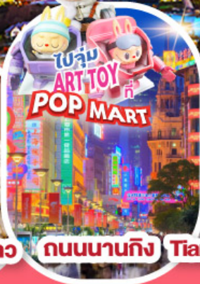
ถนนนานกิง