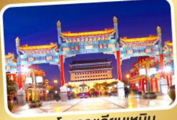
ถนนโบราณเทียนเหมิน