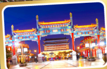
ถนนโบราณเทียนเหมิน