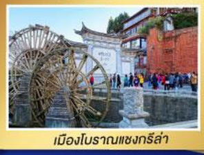
เมืองโบราณแชงกรี่ล่า