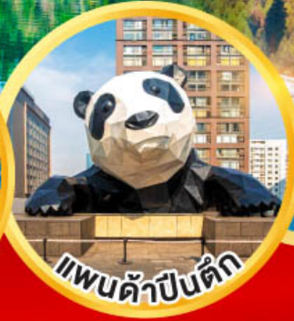
แพนด้าปิ่นดึก