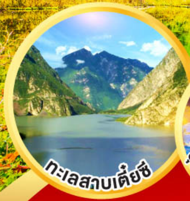
ทะเลสาบเต๋ยซี