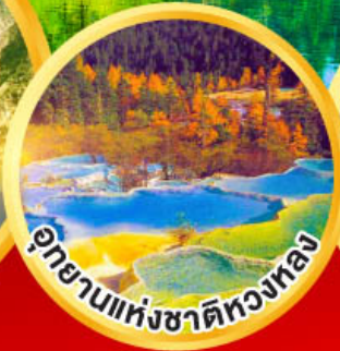
อุทยานแห่งชาติหลงหลง