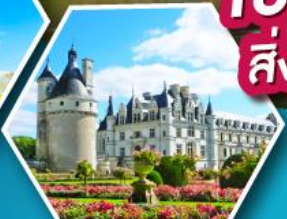
ปราสาทเชอนงโซ

เข้าชมมหาวิหารมองต์แซงต์มิเชล สิ่งมหัศจรรย์ของประเทศฝรั่งเศส