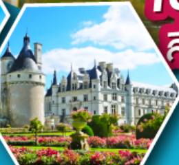
ปราสาทเชอนงโซ

เข้าชมมหาวิหารมรดกแห่งต์มิเชล สิ่งมหัศจรรย์ของประเทศฝรั่งเศส