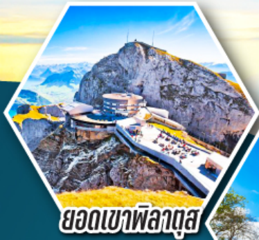
ยอดเขาพิลาตัส