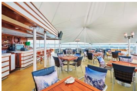
เรือล่อง น่านน้ำสากล