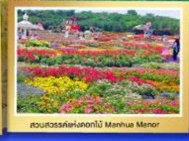
สวนสวรรค์แห่งดอกไม้ Manhua Manor