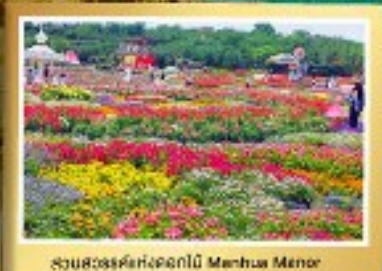
สวนสวรรค์ดอกไม้สีฤดู Mianhua Menor