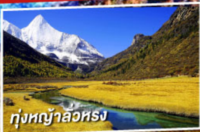
ทุ่งหญ้าลือหรง