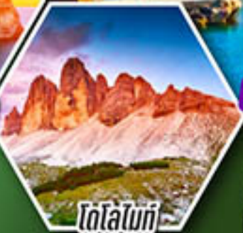
โดโลไมท์

โปรแกรมเดียว เก็บครบจบ อิตาลี ตั้งแต่เหนือถึงใต้