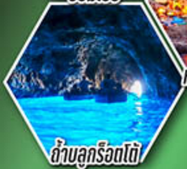
ถ้ำบลูกร็อตโต