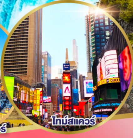
ไทม์สแควร์