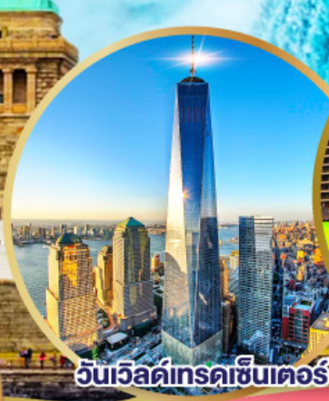
วันเวิลด์เทรดเซ็นเตอร์