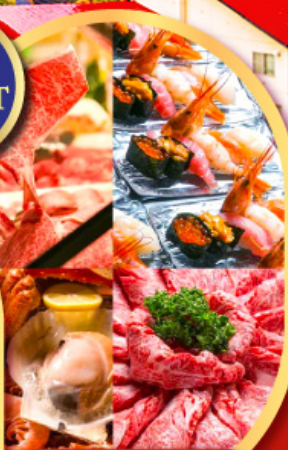
พิเศษ!! บุฟเฟ่ต์ร้าน NANDA ดีที่สุดในชิปปังโร