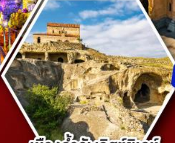
เมืองถ้ำอพลิสต์ซิเคห์