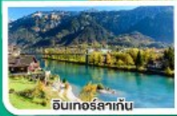
อินเทอร์ลาเก้น