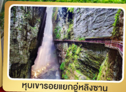
หุบเขารอยแยกอู่หลิงซาน