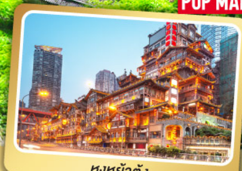
หงหย่าตัง