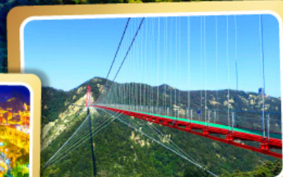
สะพานแขวนอ้ายจ้าย