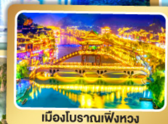
เมืองโบราณเฟิงหวง