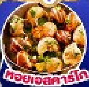
คอตสาร์ท

เดินทาง 17-25 ก.ย.67/11-19,18-26 ต.ค.67 14-22 พ.ย.67/30 พ.ย.-8 ธ.ค.67 25 ธ.ค.67 - 2 ม.ค.68(เทศกาลปีใหม่)