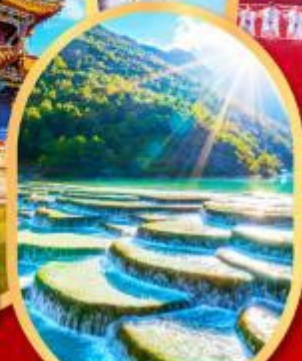
หุบเขาน้ำเงิน