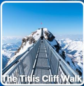
The Titlis Cliff Walk