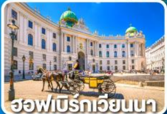
ฮอฟเบิร์กเวียนนา