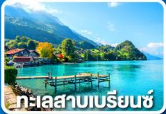
ทะเลสาบเบรียนซ์