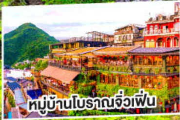
หมู่บ้านโบราณจิวเฟิ่น