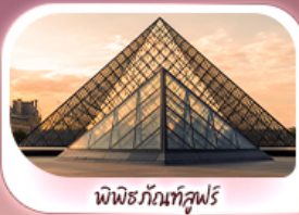
พีพริซกันท์ลุฟวร์