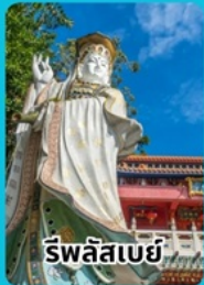
รูปลีสเบย์