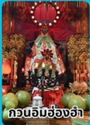
สวนอิมฮ้องฮ่า

ราคาเดี่ยวเที่ยวเกินคุ้ม 14,999 บาท/ท่าน