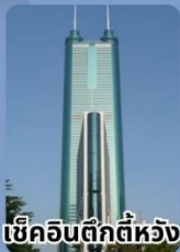
เชคอินตักตีทอง