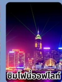
ชมไฟนีออนไฟท์

ราคาเที่ยวเที่ยวเกินคุ้ม 12,999 บาท/ท่าน