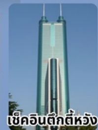
เข็ควินตีกตีห้วง