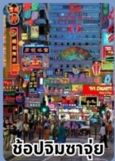
ช้อปปิ้งจางจ๋วย