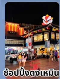
ช้อปปิ้งตงเหมิน