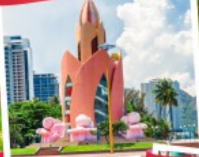
Nha Trang Cathedral