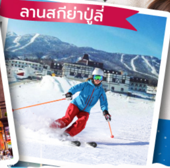
ลานสกีย่าปู้ลี