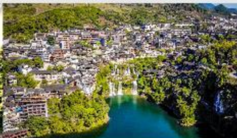
เมืองโบราณฝูหรงเจิน