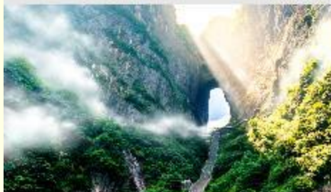
ประตูละคร