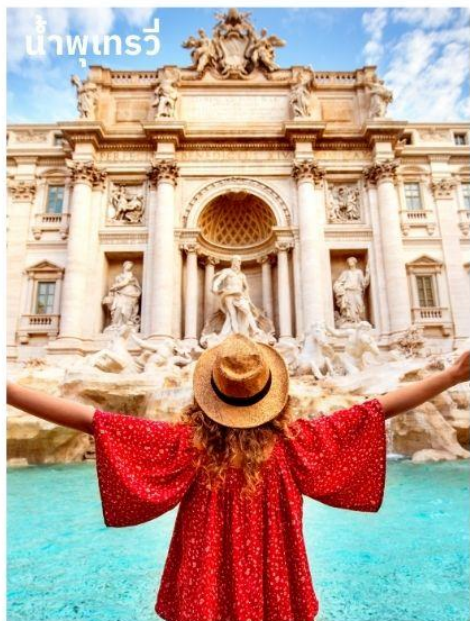
น้ำพุเทรวี่

จากนั้นอิสระตามอัธยาศัยกับการเลือกซื้อสินค้าแฟชั่นและของที่ระลึกในบริเวณย่าน บันไดสเปน (The Spanish Step) ซึ่งเป็นแหล่งแฟชั่นชั้นนำสุดหรูและยังเป็นแหล่งนัดพบของชาวอิตาเลียน