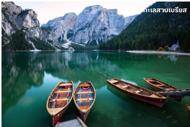
ทะเลสาบเบรียส