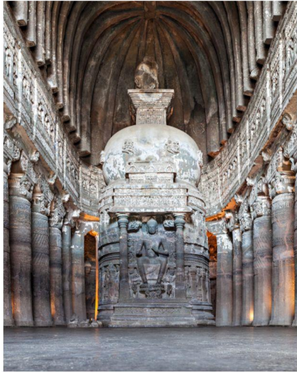
มรดกโลกทางวัฒนธรรมที่ยิ่งใหญ่ ของอินเดีย

ถ้ำเหล่านี้ถูกเจาะลึกเข้าไปใน ภูเขาเพื่อสร้างเป็นวัด มีวิหาร ขนาดใหญ่ ภายในเต็มไปด้วย งานแกะสลักหิน เป็นองค์ เจดีย์ เป็นพระพุทธรูป และ ภาพจิตรกรรมฝาผนังถ้ำ เล่า เรื่องราวต่างๆ ในพุทธประวัติ และชาดก และ ที่น่าแปลกใจ คือ ถ้ำเหล่านี้ ชุกซ่อนตัวอยู่ที่นี้มานานถึง กว่า ๑,๕๐๐ ปี