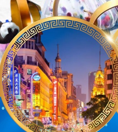
ถนนคนเดินหนานจิง