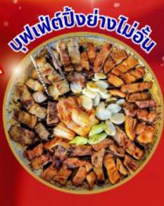
บุฟเฟ่ต์ปิ้งย่างไม่เว้น