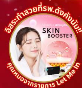
อิสระทำสวยที่พ.ดังคังนัม!! SKIN BOOSTER คุณนงนารถรายการ Let Me In

ชมจอ LED ขนาดยักษ์ที่รีสอร์ท 5 ดาว ใหญ่ที่สุดในเอเชียเหนือ ชมพระราชวังเคียงบกกุง ย่านอดีตหมู่บ้านบุคซอน ฮันอก ใส่ชุดฮันบก ทำข้าวห่อสาหร่าย อิสระช้อปปิ้ง Lotte Duty Free