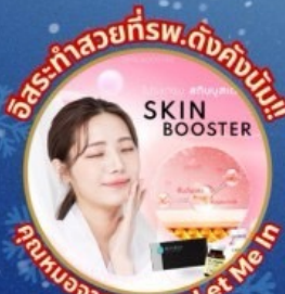
อิสระทำสวยที่รพ.ดังคั้งนับ!!! SKIN BOOSTER บริการนวดผ่อนคลาย Let Me In