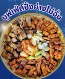
บุฟเฟ่ต์ปิ้งย่างไม่วัน

ชมจอ LED ขนาดยักษ์ที่รีสอร์ท 5 ดาว สักการะวัดจนถึงชา วัดโบมุนชา วัดชุกกชาวัดทองที่ใหญ่ที่สุดในเอเชีย วัดซัมซอนชา วัดพงอินชา พระพุทธรูปขนาดใหญ่ของโซล ชมพระราชวังเคียงบกกุง ห้องสมุดสุดอลังการ อิสระช้อปปิ้ง Lotte Duty Free