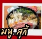
เมนู: สุกี้

สุสานทหารดินเผาจีนซี ถ้ำหลงเหมิน ถนนวัฒนธรรมราชวงศ์ถัง ถนนคนเดินประตูโบราณลี่จิ้นเหมิน กำแพงเมืองโบราณ ร้านPOP MART วัดเส้าหลิน ป่าเจดีย์ ชมการแสดงกังฟู