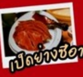
เป็ดย่างซีอาน