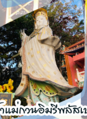
เจ้าแม่กวนอิมรัพลัสเบง