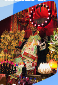
เจ้าแม่กวนอิมขี้มเงิน