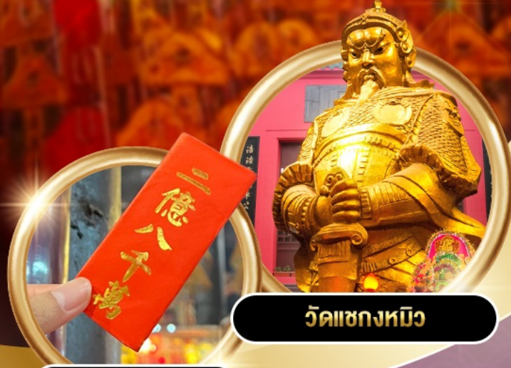
วัดเซ่งเตง