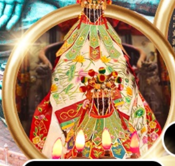
เยี่ยมเงินเจ้าแม่กวนอิมสองอำ