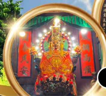
ขอพรซื้อขายอสังหาริมทรัพย์