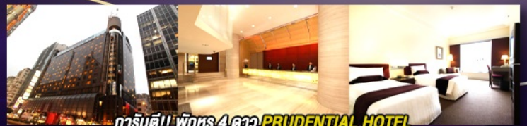
гаринті!! พักหรู 4 ดาว PRUDENTIAL HOTEL ติดถนนนาราน ย่านช้อปปิ้งจิมซาจู้