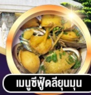
เมนูซีฟู้ดลิ้นมดุน