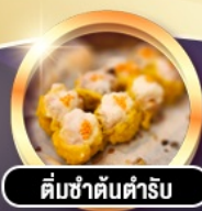
ติ่มซำต้นตำรับ

ต.ค. 4-6, 5-7, 11-13, 12-14, 13-15, 18-20, 19-21, 20-22, 21-23, 22-24, 23-25, 24-26, 25-27, 26-28 ส.ค. 5-7, 6-8, 7-9, 8-10, 28-30, 29-31, 30-1, 31-2