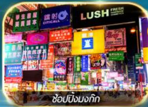
ช้อปปิ้งมงก๊ก

เต็มอิ่มทั้งบุญ และ ช้อปปิ้งแบบจัดเต็ม จิมซาจุ้ย มงก๊ก