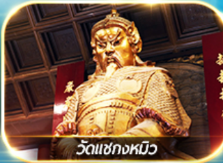
วัดเซ็กกหมิว