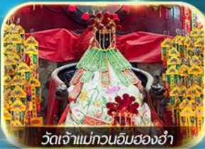
วัดเจ้าแม่กวนอิมสองอ่า