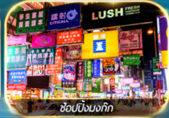
ช้อปปิ้งมอลล์

เต็มอิ่มทั้งบุญ และ ช้อปปิ้งแบบจัดเต็ม จิมซาจุ่ย มงก๊ก