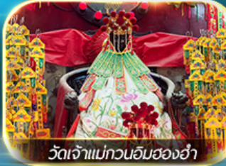
วัดเจ้าแม่ทวนอิมของอ่ำ