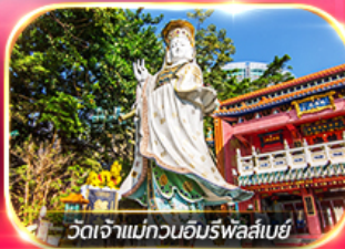
วัดเจ้าแม่กวนอิมรพหลสัย